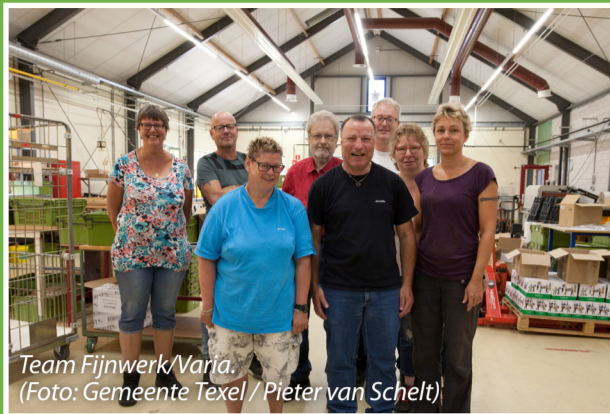
Team Fijnwerk/Varia.

Samen met de afdeling Fijnwerk/Varia produceert de Houtzagerij onder meer sjoelbakken – drie soorten – en garnalennetten, in twee maten. Voor de sjoelbakken wordt vurenhout tot latjes verzaagd, geschaafd in de machine, ingekort tot den juiste lengte en voorzien van ronde hoeken. Dan wordt het materiaal naar de afdeling Fijnwerk gereden, waar de sjoelbakken worden gemonteerd. "We zetten ze hier in elkaar", vertelt een medewerker op de afdeling. "Vervolgens worden ze in de Houtzagerij geschuurd en komen ze weer hier. De grote bakken worden gelakt of gelied, de kleine kunnen zo worden geseald. De productiedruk is nu het hoogst: de sjoelbakken moeten in de winkel liggen vóór Sinterklaas inkopen gaat doen."